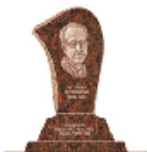
2015 Rokiem inż. Józefa Nowkuńskiego

Konto bankowe: 38 1160 2202-0000 0000 2741 3872 NIP: 526-030-05-23