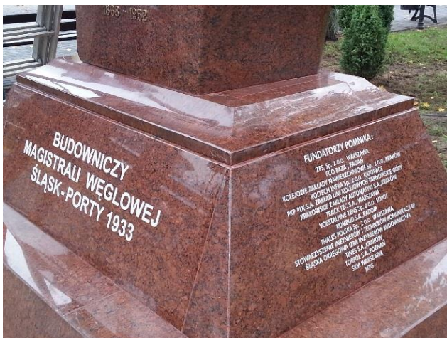
Na postumencie wypisani fundatorzy pomnika