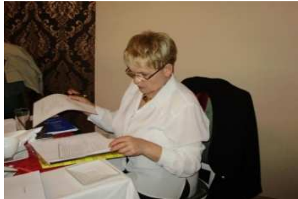
Pierwsze obrady plenarne KKS w Warszawie, wybór Prezydium KKS SITK RP