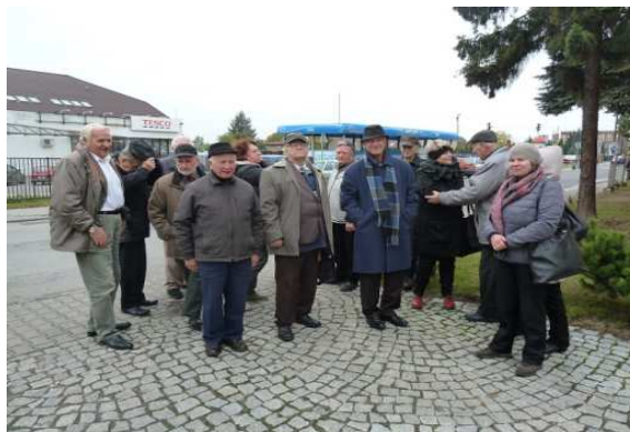
Dworzec Tarnowskie Góry oraz zwiedzanie miasta.

Następnie odbyły się obrady plenarne, podczas których między innymi zostały zatwierdzenia ustaleń z pobytu w Poznaniu.