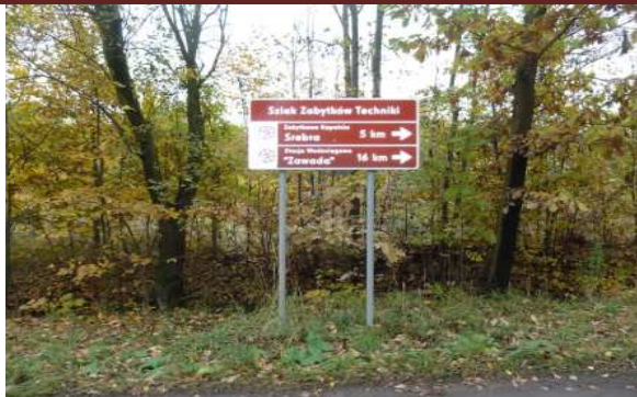
Szlak zabytków Techniki.