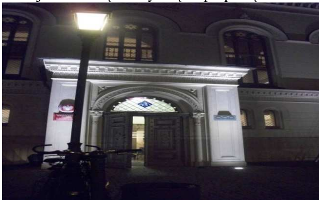
Portal główny synagogi

Wrażenia pozytywne, z nadzieją na dalszą efektywną współpracę.