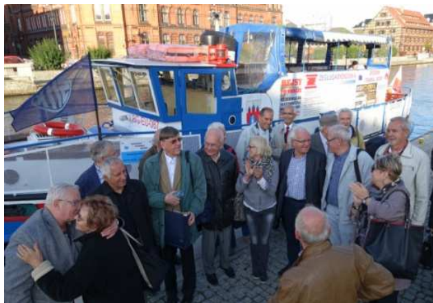
Zdjęcia z holownika M/S „Bydgoszcz” (pod banderą SITK)