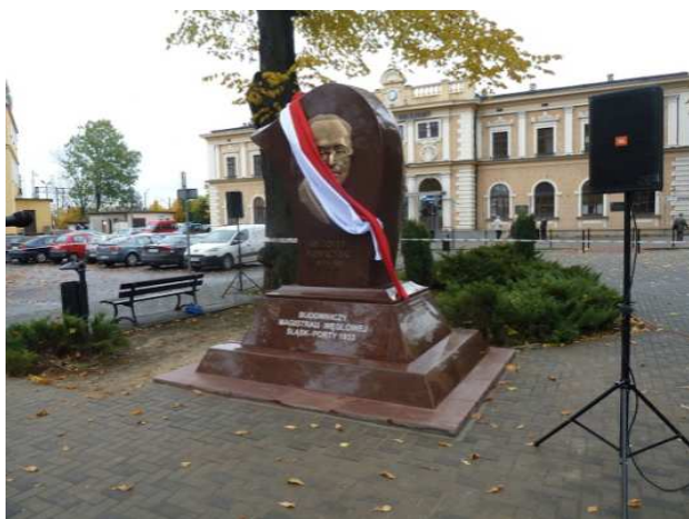
Pomnik inżyniera Nowkuńskiego

Po wyjściu na powierzchnię zwiedzający udali się, spacerem przez las do mikrobusu i pojechali w kierunku dworca kolejowego gdzie wszyscy zebrani uczestniczyli w uroczystości odsłonięcia pomnika Inżyniera Nowkuńskiego. Po ceremonii odbyło się uroczyste spotkanie w Domu Technika, z referatami i przekąskami,