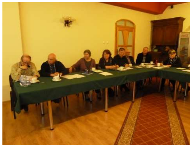
Obrady plenarne uczestników spotkania

Drugiego dnia po śniadaniu wszyscy udali się na zwiedzanie zabytkowej kopalni srebra pod Tarnowskimi Górami, spacerem przez las (park) dotarli do szybu SYLWESTER i zeszli schodami 60 m pod powierzchnię, popłynęli sztolnią (czterema barkami) o długości 600 m do szybu EWA . Oczywiście cały czas był z nimi przewodnik, który własnoręcznie "ciągnął" te barki i opowiadał o historii kopalni.