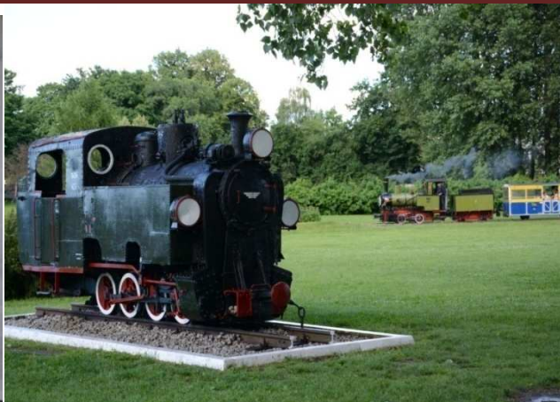
Podróż kolejką "Maltanka"

W Zespole Szkół Komunikacji w Poznaniu odbywały się obrady KKMHiZT oraz prelekcje okolicznościowe na temat historii węzła kolejowego Poznań, historii kolei dojazdowych w byłej ZDOKP oraz przewozów wagonów normalnotorowych na wąskich torach.