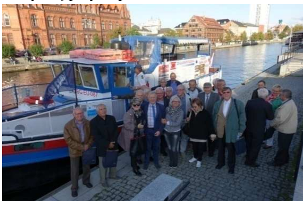
Zdjęcia z „LEMARA”